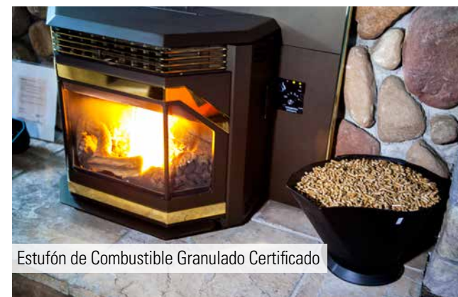
Estufón de Combustible Granulado Certificado