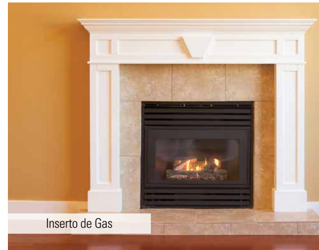
Inserto de Gas

RECUERDA: Siempre es ILEGAL quemar basura y hacer lumbradas en barriles.