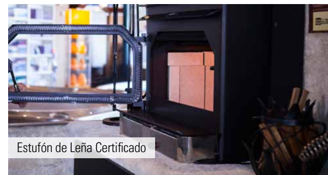
Estufón de Leña Certificado