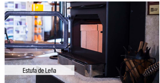
Estufa de Leña