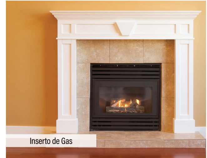
Inserto de Gas

Nunca queme basura, revistas, periódicos, plásticos, desechos de jardín u otros materiales en ningún aparato de leña para interiores o exteriores. Hacerlo es ilegal y peligroso.