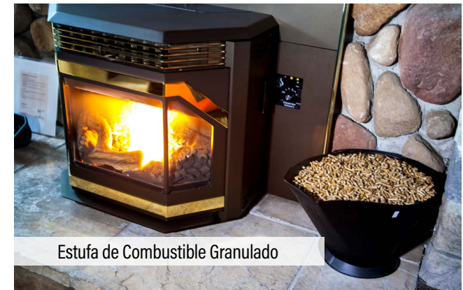
Estufa de Combustible Granulado