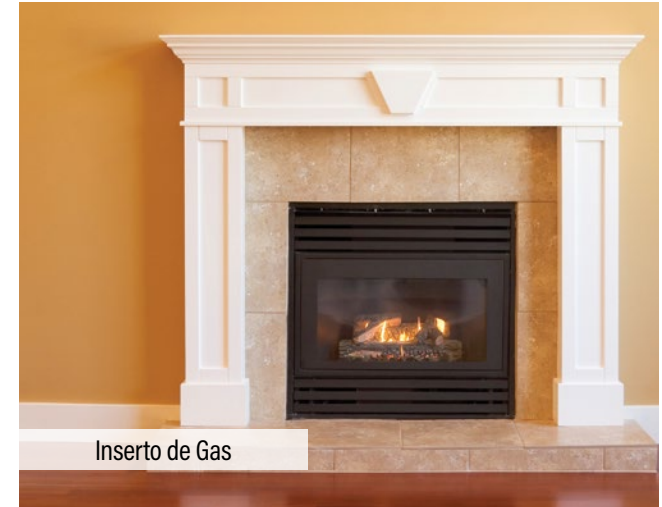
Inserto de Gas

Nunca queme basura, revistas, periódicos, plásticos, desechos de jardín u otros materiales en ningún aparato de leña para interiores o exteriores. Hacerlo es ilegal y peligroso.