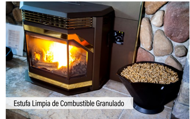
Estufa Limpia de Combustible Granulado