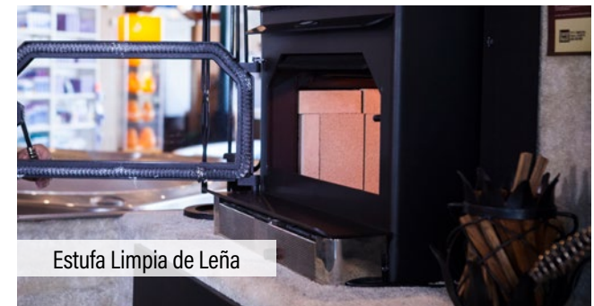
Estufa Limpia de Leña